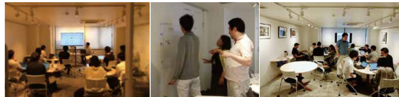
写真: 講義やグループワークの様子

講座でのスキルアップはもちろんですが、さまざまな分野で活躍する方々と一緒に学ぶことで新しい知見が得られました。またこのようなコミュニティに参加できたことの価値は今後のキャリアにおいてとても素晴らしい財産になると感じました。